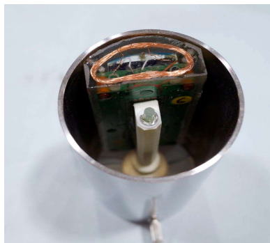
図 2 本体底部