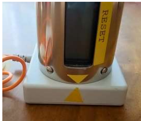
図 6 マーカーに合わせる

充電が始まると、赤色の充電表示灯が点灯します。 電池が満充電になった、もしくは、20時間後に緩やかな充電になりますと、充電表示灯は点滅に変わります。