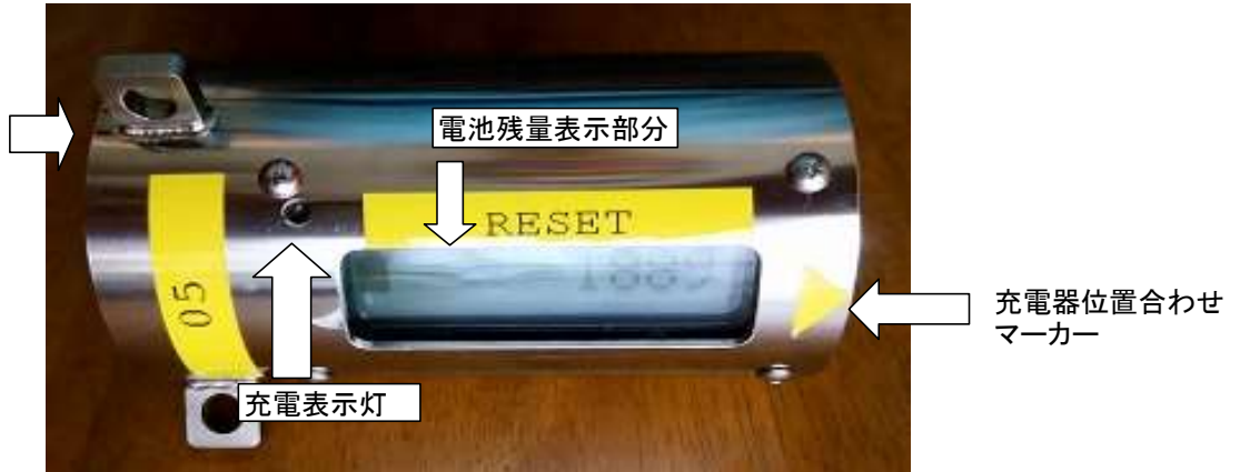
図 1 本体