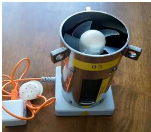
図 5 充電器に乗せる

充電器の白丸部分に図 5 のように本体を乗せ、 図 6 のように充電器と本体の黄色の三角のマーカークを合わせます。 USBコンセントを給電します。 充電中は表示部分のリセットは出来ません。